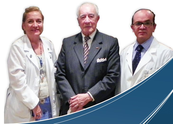
Alumnos Egresados 2a. Generación

Gerentes y profesionales de las Instituciones Públicas y Privadas de diferente complejidad, que deseen formarse integralmente en la Gerencia de Servicios Médicos y la Metodología de Certificación de Unidades Médicas, los aspirantes podrán ser Directores, Jefes de Servicio y Departamento, Coordinadores de Área, Supervisores, Asesores Ejecutivos, personal con grado de licenciatura: Médicos, Paramédicos, Profesionales en áreas de apoyo administrativo, de soporte vital y en formación, así como personal que aspire a ocupar puestos administrativos y de control en Unidades Médicas.